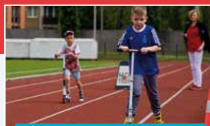
Spartakiada Dzieci i Młodzieży