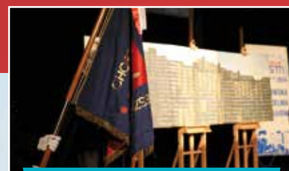
Jubileusz 110-lecia ChSM