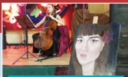
Galeria Spełnionych Marzeń