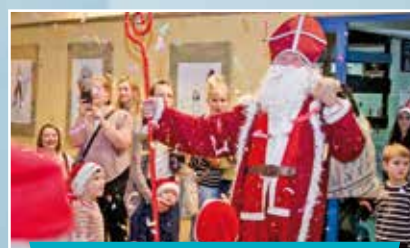
Spotkanie ze św. Mikołajem