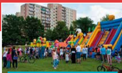
Festyn Spółdzielczy na Klimzowcu