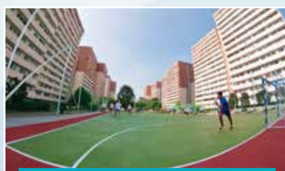
Nowe boisko na Osiedlu „Irys”