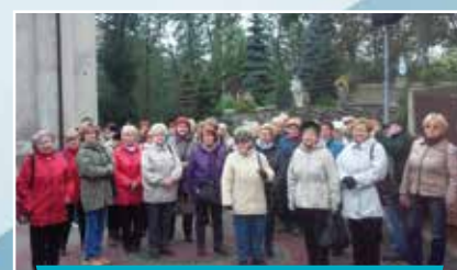
Wycieczka dla samotnych Spółdzielców