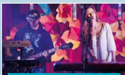
Koncert w Klubie „Pokolenie”