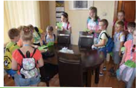
Półkoloniści odwiedzili m.in. dyrekcję Chorzowskiej Spółdzielni Mieszkaniowej