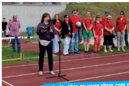
relacja video na www.chsm.com.pl