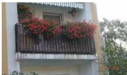
Ul. Mariańska 47