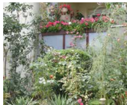
Ul. Rodziny Oswaldów 4