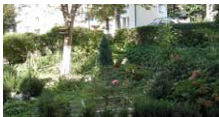
Ul. Wolskiego 15