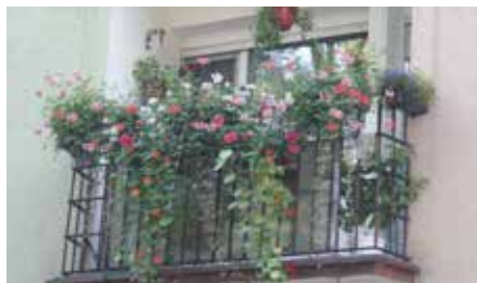
Ul. Wolskiego 20