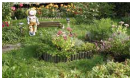
Ul. Józefa 3