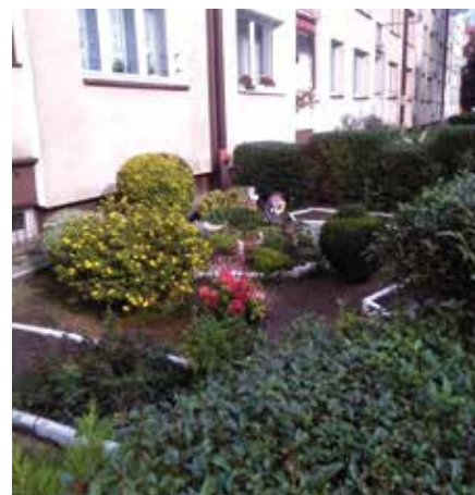
Ul. Gwarecka 19