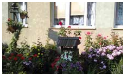
Ul. Styczyńskiego 77