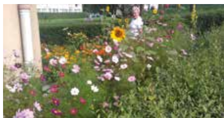
Ul. Boczna 10