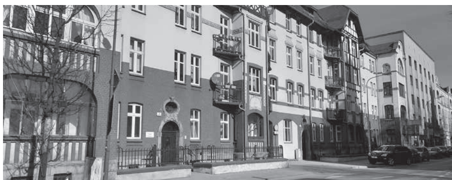
Jeden z pierwszych bloków spółdzielczych, ul. Dąbrowskiego.

Spacer ma formę otwartą, a udział w nim nie wymaga zapisu. Zbiórka uczestników o godz. 9.00 przy budynku Administracji Centrum - ul. Krasickiego 7a. Czas trwania spaceru uzależniony będzie od warunków pogodowych oraz kondycji fizycznej uczestników. O kolejnych spacerach będziemy informować na bieżąco.