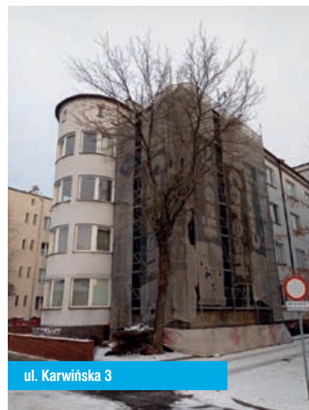
ul. Karwińska 3

Na styczniowym posiedzeniu Rada Osiedla dokonała oceny pracy firm sprzątających w okresie zimowym, zapoznała się z bieżącą sytuacją grzewczą na Osiedlu oraz omówiła sprawy bieżące.