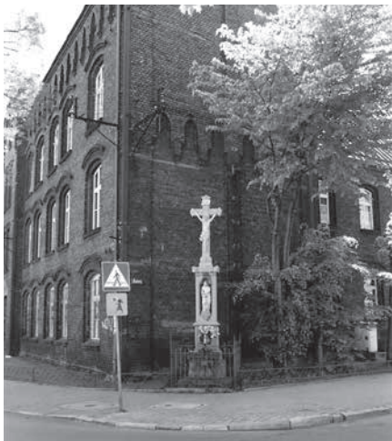
Krzyż u zbiegu Kaliny i 16 Lipca na tle szkoły

Kaliny miesza się z blokową zabudową mieszkaniową, do której zalicza się wiele bloków Chorzowskiej Spółdzielni Mieszkaniowej.