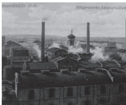
Zakłady Rudolfa Rüttgersa

smarek z Świerklańca. W 1866 roku od hrabiego kupił go Królewska Huta, zaś po likwidacji w 1894 roku obszaru dworskiego Górnych Hajduk teren ten włączony został do gminy Górne Hajduki. Ostatecznie w 1903 roku połączono Dolne i Górne Hajduki w jedną gminę o nazwie Bismarckhütte. Mimo to nazwa Kalina używana jest do dziś i odnosi się również do stawu znajdującego się na pograniczu Chorzowa i Świętochłowic przy ul. Lipowej, powstałego pod koniec