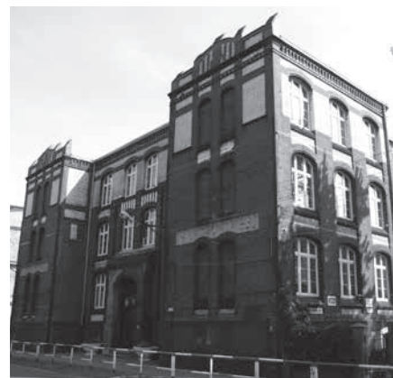
Szkoła im. Sportowców Hajduckich

Nakryty płaskim dachem w korpusie budynku, a pozostała część dwuspadowa w ustawieniu szczytowym w południowej części budynku. Część wschodnia budowli wysunięta w formie skrzydła, gdzie przylega do niej ryzalit mieszczący wejście do budynku. Pierwotne wejście główne znajdowało się w środkowym ryzalicie obecnie jednak jest zamurowane. Była to pierwotnie szkoła powszechna męska, dzisiaj zaś to Szkoła Podstawowa nr 32 im. bł. ks. Józefa Czempieła.