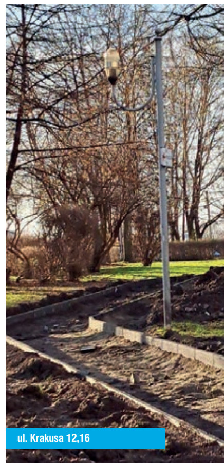
ul. Krakusa 12,16

Na styczniowym posiedzeniu członkowie Rady Osiedla zapoznali się z analizą dewastacji do których doszło w zasobach administracji w roku 2022, a także zapoznali się z informacją o zasiedlonych mieszkaniach z odzysku w 2022 roku oraz posiadanych pustostanach na dzień 31.12.2022r. Omówiono sprawy bieżące.