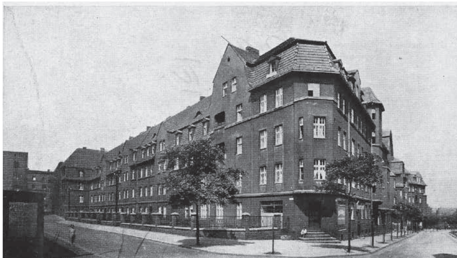
Blok przy ul. Barskiej-Stalmacha

Celem spacerów jest ukazanie członkom i mieszkańcom naszych osiedli najciekawszych miejsc i zabytków związanych z bogatą historią Chorzowskiej Spółdzielni Mieszkaniowej i Chorzowa. Zaplanowano cztery spacery, jeden po każdej z czterech Administracji Osiedli ChSM. Pierwszy z nich odbędzie się 18 marca 2023r. i będzie prowadził ulicami Administracji Centrum.