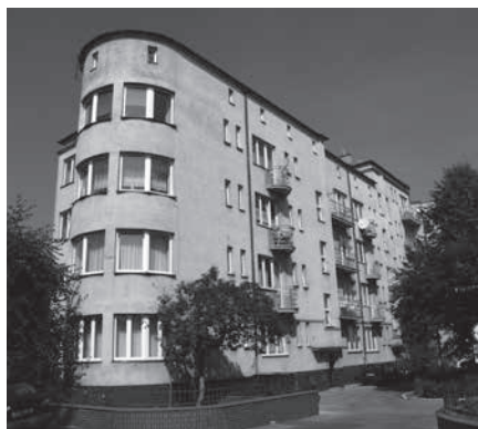
Budynek przy ul. Karwińskiej

Budynek szkolny przy ul. Kaliny 61 wzniesiony został w 1893 roku według projektu Arthura Niestroja i rozbudowany w początkach XX wieku. Obiekt na planie litery „L”, murowany z czerwonej cegły licówki, częściowo tynkowany, trójkondygnacyjny, podpiwniczony.