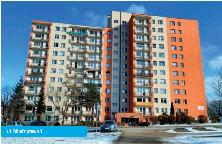
ul. Młodzieżowa 1

Podczas posiedzenia w styczniu 2023 roku Rada Osiedla „Różana Gałęczki” przyjęła sprawozdanie z działalności w roku 2022. Dokonano oceny pracy Administracji i konserwatorów osiedlowych. Omówiono sprawy związane z realizacją planu remontów w roku 2022. Rozpatrywano również sprawy bieżące i wniesione przez mieszkańców osiedla.