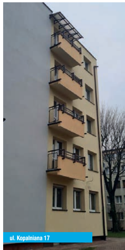
ul. Kopalniana 17

Na posiedzeniu Rada dokonała oceny utrzymania zasobów w okresie zimowym. W ocenie Członków Rady, firmy które świadczą dla ChSM usługi sprzątania dobrze wywiązują się z powierzonych prac. Członkowie Rady zachęcają mieszkańców do zgłaszania na bieżąco zauważonych nieprawidłowości. Ponadto Rada Osiedla zapoznała się z zasadami wyboru wykonawców robót remontowych. W ChSM obowiązuje „Regulamin udzielania zamówień na wykonywanie robót budowlanych i usług realizowanych w zasobach ChSM” który reguluje powyższe.