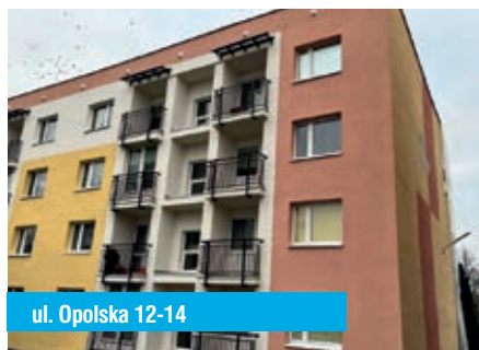
ul. Opolska 12-14