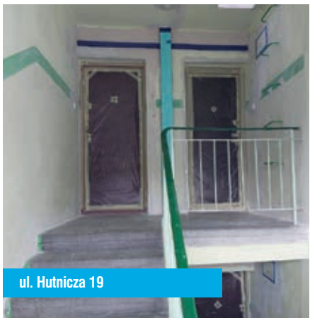
ul. Hutnicza 19

Zgodnie z harmonogramem dokonano rocznych przeglądów instalacji gazowej