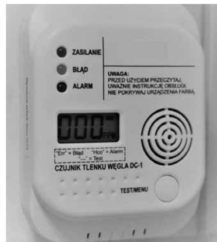
Przykładowy czujnik tlenu węgla. Czujniki można zakupić w sklepach z materiałami budowlanymi.

Pamiętajmy, iż pierwsze oznaki zatrucia tlenkiem węgla to duszność, ból i zawroty głowy, nudności, wymioty, oszołomienie, osłabienie, przyspieszenie pracy serca i oddychania. Nie należy lekceważyć tych objawów, a kiedy się pojawią trzeba podjąć bezzwłocznie skuteczne działania polegające na: