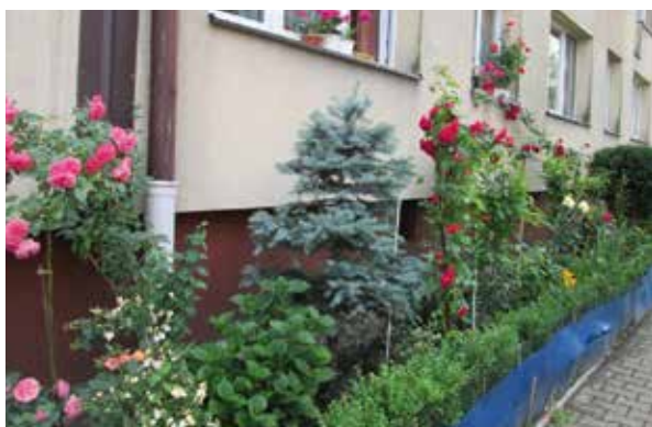
ul. Kaliny 70