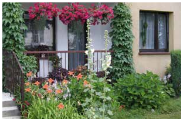
ul. Mariańska 61