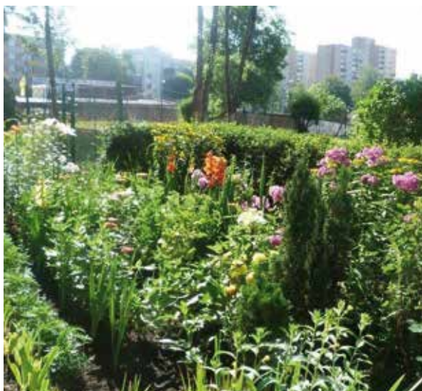
ul. Krzywa 41