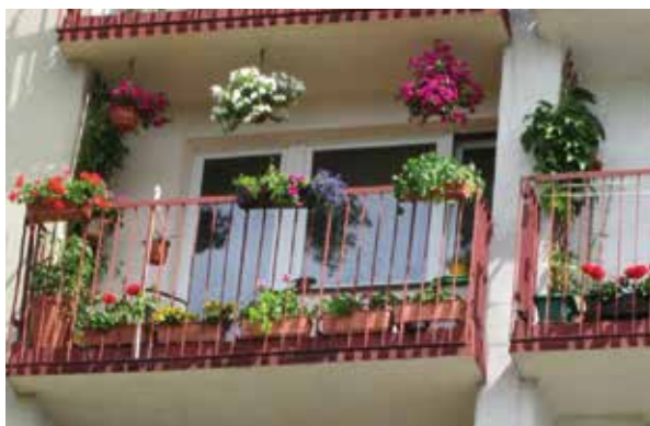
ul. Graniczna 62