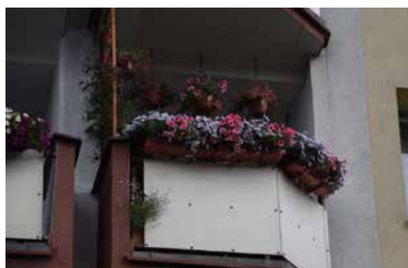
ul. Krzyżowa 30